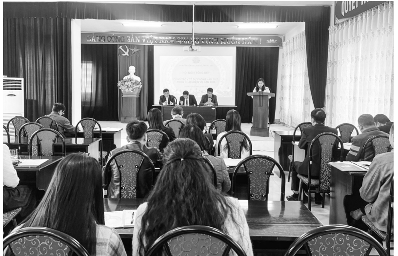
Trung tâm Kiểm soát bệnh tật tỉnh tổng kết công tác Y tế dự phòng năm 2025

Năm 2025, Trung tâm Kiểm soát bệnh tật tỉnh thực hiện đạt và vượt 95/96 chỉ tiêu ngành Y tế giao (99%). Tình hình các bệnh truyền nhiễm trên địa bàn tỉnh tương đối ổn định, không có dịch lớn xảy ra, ghi nhận 02 chùm ca bệnh thủy đậu tại phường Đoàn Kết, Tân Phong. Số ca mắc Sởi tăng cao, đặc biệt từ tháng 3 - 5/2025, ghi nhận ca mắc hầu hết các xã, phường trên địa bàn tỉnh, đến tháng 6/2025 số ca mắc Sởi giảm và đến nay đã được kiểm soát tốt. Ngoài ra, một số bệnh truyền nhiễm trong chương trình tiêm chủng mở rộng có chiều hướng gia tăng trở lại như: Sởi, Uốn ván sơ sinh, bệnh Ho gà. Ghi nhận 06 trường hợp tử vong, trong đó 03 trường hợp tử vong do UVSS: Tủa Sín Chải (01), Xã Phong Thổ (01), xã Pa Tần (01); 03 trường hợp tử vong do dại: xã Mường Khoa (01); xã Bum Tở (01); phường Tân Phong (01).