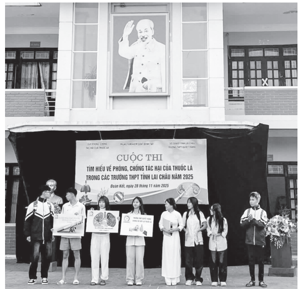
Học sinh trường THPT Quyết Thắng tham gia Hội thi PCTHTL

Với mục tiêu nhằm nâng cao kiến thức cho các em học sinh về tác hại của thuốc lá, thuốc lá điện tử, thuốc lá nung nóng, Shisha, từ đó xây dựng môi trường, lối sống lành mạnh không khói thuốc trong nhà trường, gia đình. Bằng hình thức thi bốc thăm trả lời các câu hỏi dưới dạng trắc nghiệm đã được biên soạn về các nội dung về tác hại của thuốc lá, thuốc