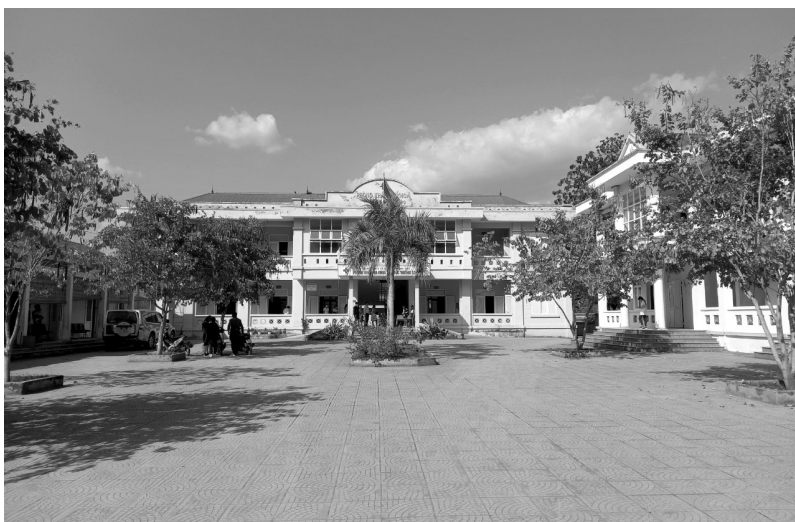
Khuôn viên Trạm Y tế xã Phong Thổ Xanh - Sạch - Đẹp và thoáng mát

Chị Lò Thị Hương, bản Đoàn Kết, xã Phong Thổ cho biết: Mỗi lần đến khám bệnh tôi thấy Trạm Y tế rất sạch sẽ, thoáng mát giúp tôi cảm thấy thoải mái và yên tâm hơn khi đến khám và điều trị bệnh. Đặc biệt là sự nhiệt tình, tận tâm của các cán bộ y tế làm cho tôi cảm thấy hài lòng khi