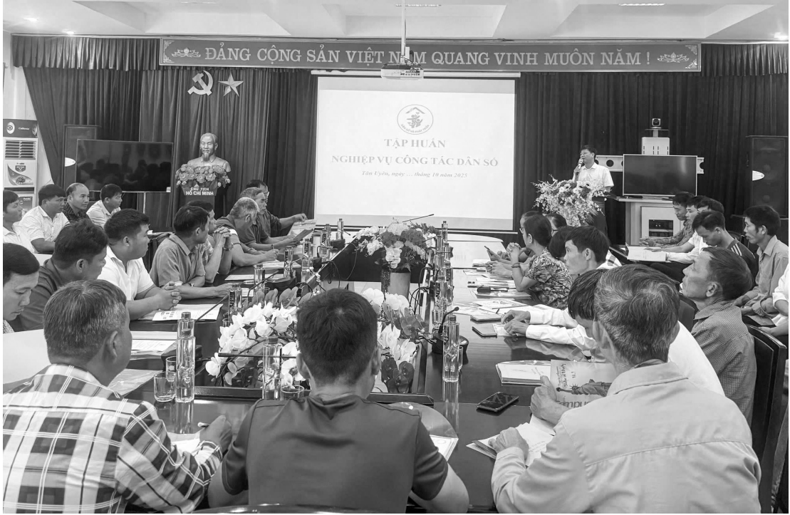
Cán bộ Chi cục Dân số tập huấn nghiệp vụ công tác dân số cho y tế thôn bản và dân số xã Tân Uyên

N ghị quyết số 40/NQ-HĐND ngày 20/9/2022 của Hội đồng nhân dân tỉnh quy định chính sách khen thưởng, hỗ trợ đối với tập thể, cá nhân thực hiện tốt công tác dân số trên địa bàn tỉnh Lai Châu không chỉ đơn thuần là động viên, khích lệ còn là động lực thúc đẩy phong trào thi đua thực hiện tốt công tác dân số tại cơ sở. Hơn 3 năm triển khai, nghị quyết góp phần rõ nét vào việc cải thiện chất lượng dân số, thúc đẩy phát triển bền vững ở các bản vùng sâu, vùng xa, vùng cao, biên giới của tỉnh.