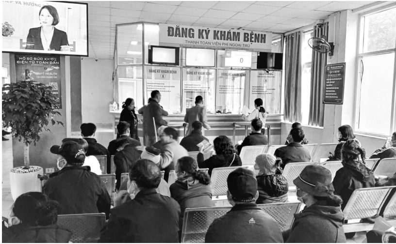
Người dân chờ khám bệnh tại BVĐK tỉnh

H ội đồng Nhân dân (HĐND) tỉnh Lai Châu vừa ban hành Nghị quyết số 110/2025/NQ-HĐND, ngày 09/12/2025 Quy định mức hỗ trợ đóng Bảo hiểm y tế (BHYT) cho hộ gia đình cận nghèo; học sinh, sinh viên là người dân tộc thiểu số; người thuộc hộ gia đình làm nông nghiệp, lâm nghiệp, ngư nghiệp có mức sống trung bình trên địa bàn tỉnh Lai Châu giai đoạn 2026 - 2030.