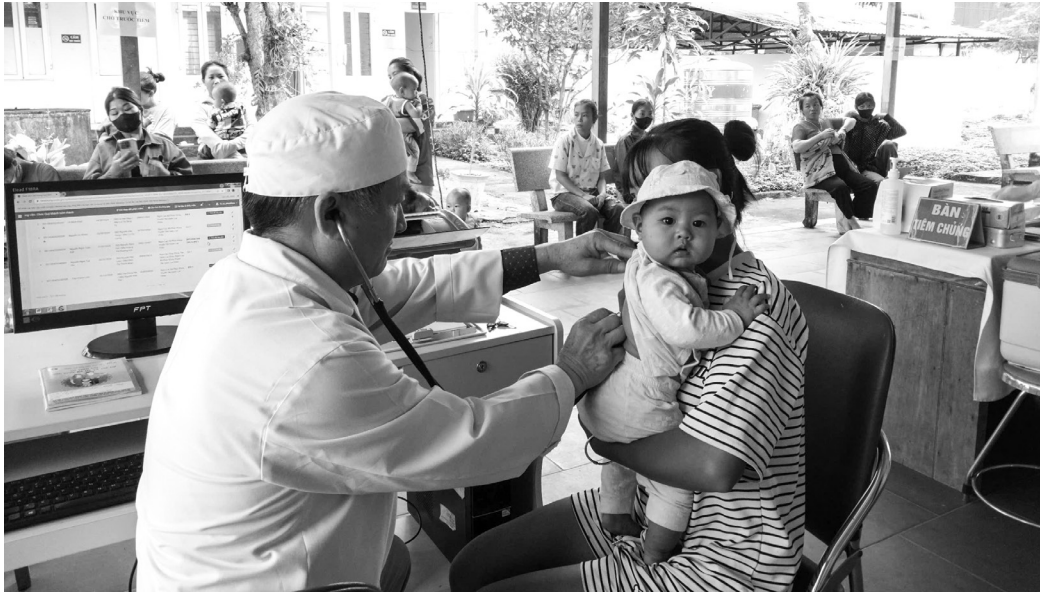
Cán bộ trạm y tế xã Mường Khoa khám bệnh cho bệnh nhân

Nhớ lời căn dặn của Bác Hồ năm xưa “Người thầy thuốc chẳng những có nhiệm vụ cứu, chữa bệnh tật mà còn phải nâng đỡ tinh thần những người ốm yếu”, thấm nhuần lời dạy của Bác, thời gian qua, các y, bác sĩ Trạm Y tế xã Mường Khoa không ngừng tu dưỡng, phấn đấu rèn luyện phẩm chất đạo đức, lối sống theo tư tưởng, đạo đức, phong cách Hồ Chí Minh. Khắc phục mọi khó khăn, nêu cao tinh thần trách nhiệm để nâng cao chất lượng chăm sóc sức khỏe (CSSK) cho Nhân dân.