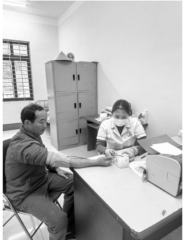
Cán bộ trạm y tế xã Bum Nua khám bệnh cho người dân

Xác định được tầm quan trọng của công tác truyền thông giáo dục sức khỏe, những năm gần đây, các ban, ngành, đoàn thể tại địa phương, nhất là trạm Y tế luôn chú trọng thực hiện công tác truyền thông giáo dục sức khỏe và công tác này ở xã cũng đã đạt được một số kết quả đáng ghi nhận, góp phần nâng cao sức khỏe của Nhân dân trên địa bàn. Năm 2025, xã tổ chức 57 buổi nói chuyện về kiến thức phòng, chống các loại dịch bệnh như: Bệnh tay, chân, miệng; bệnh sởi; bệnh dại... cho 2.052 lượt người tham dự. 22 buổi nói chuyện trực tiếp về vệ sinh an toàn thực phẩm, vệ sinh môi trường; tổ chức truyền thông trực tiếp cho 698 lượt người nghe về các biện pháp dự phòng lây nhiễm HIV từ mẹ sang con. Ngoài ra, còn tổ chức lễ phát động và tuyên truyền phòng, chống bệnh tay chân miệng, sốt xuất huyết tại cộng đồng, cấp phát hàng trăm tờ rơi, pa nô, áp phích về phòng, chống các loại dịch bệnh cho Nhân dân.